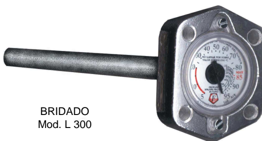
BRIDADO Mod. L 300